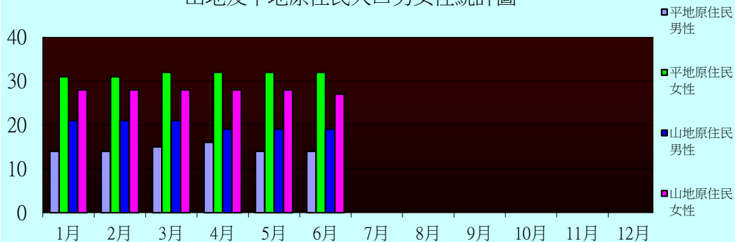
山地及平地原住民人口男女性統計圖