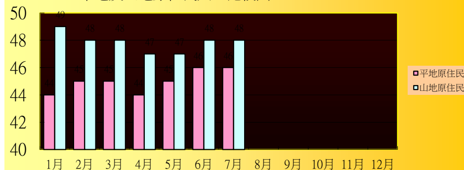
平地及山地原住民人口比較圖