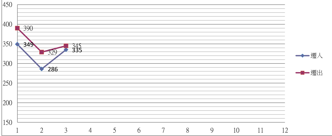
員林市113年遷入、遷出統計圖