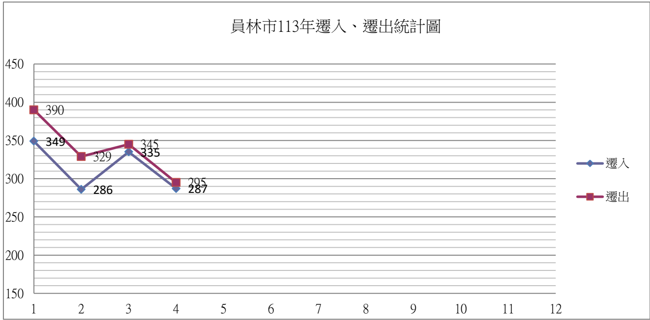
員林市113年遷入、遷出統計圖