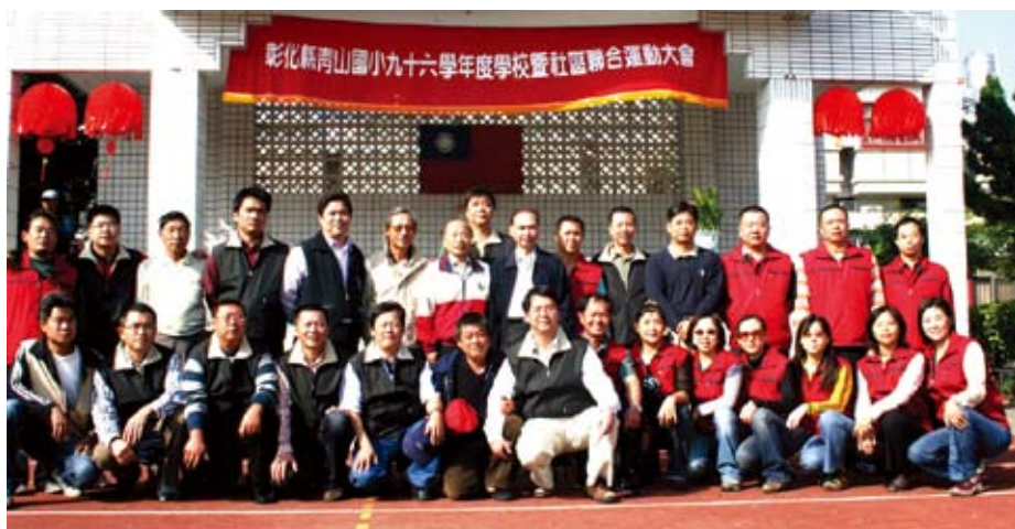
◆青山國小家長會和校長行政團隊合影。