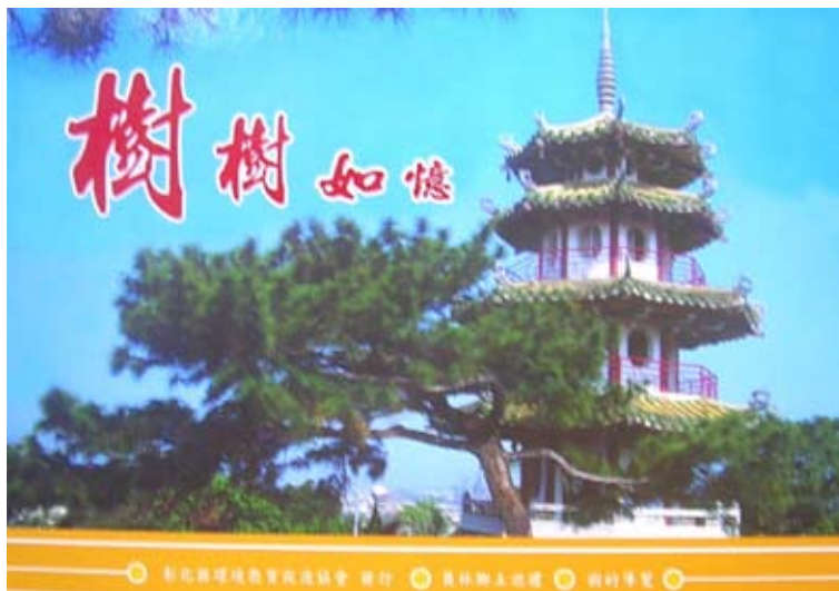
◆彰化縣環境教育促進協會2004出版。