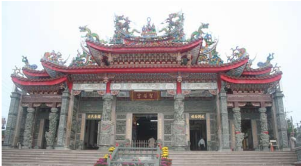
◆泉州寮柿仔腳吳厝土地上，1988年11月「聖后宮」落成。

聖后宮落成後，安座媽祖坐鎮本殿，媽祖成爲庄民爭相「請回」祭祀的對象。然而，泉州寮媽祖坐大廟沒幾年，一個空前災難來臨。木墻和清發描素，一天庄民發現，原本端坐正殿，木刻七吋二的媽祖金身不見了，現場只剩鳳冠，過沒多久，連鳳冠都被偷走了，媽祖失竊的消息傳遍百果山，庄民急問如何尋回？透過乩童，庄民似乎得到媽祖的回應。至今庄民都仍表示，媽祖說是她的劫數，要到外頭流浪！然而，庄民仍舊翹首期盼泉州寮媽祖回鑾，相信，他日良辰吉時機緣一到，或許庄民會歡喜將泉州寮媽祖迎接回家。