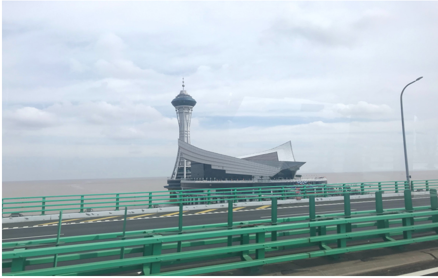
杭州灣內跨海大橋與特色 休息站