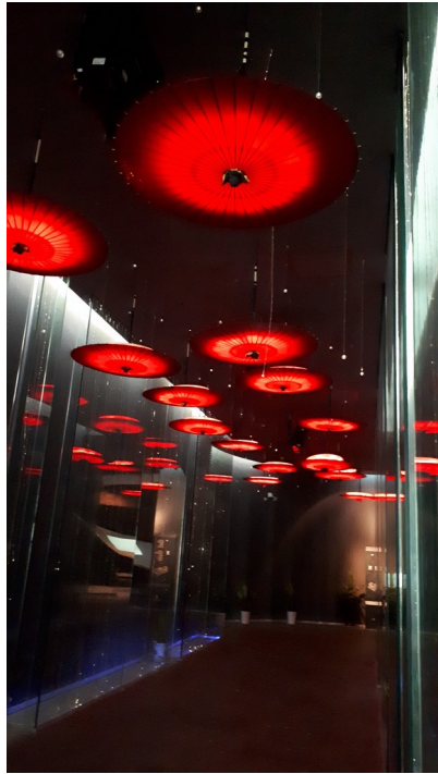
傘博物館的入口意象具有 主題特色