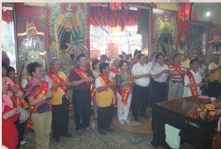
◆南壇宮城隍爺遶境廟會（楊銘欽攝2009）

毛蟹，信奉田都的劇團人員諸多不吃毛蟹，以報毛蟹之恩，做戲娛樂並感謝。團主從小演歌仔戲，懷孕時演，生產完一週也演，生病或疲累照樣得演，雖然辛苦卻早已習慣了。三個女兒已經擔任主要角色，外孫讀幼稚園也會扮童子，團員幾乎都是從孩童就接觸歌仔戲，多半是員林人，也有幾位是外地人。戲團全台巡迴演出，花蓮、基隆、宜蘭等，再遠也都得出演，有一次去中壢演出，有位觀眾接連看了幾天，拍手叫好，主動捐助舞台戲板。