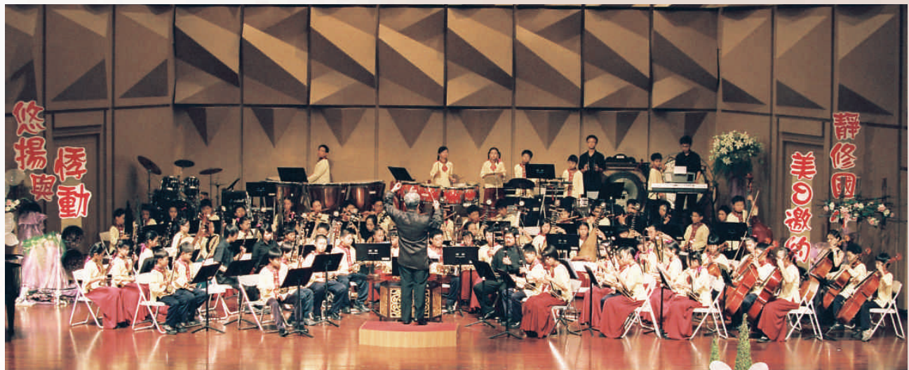
◆員林演藝廳靜修國樂團演出（黃文亮攝2008）