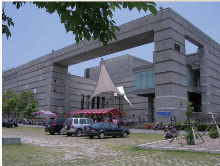
◆員林演藝廳

演藝廳小劇場專供講座、小劇團、傳統戲曲、研習活動、會議等功能，活動式的觀眾席可調整座椅，約容納三百名觀眾。至於二樓挑高的展覽空間，安排各種藝術展覽，讓民眾獲得美的薰陶，留下美的生活回憶。圖書室分為一般閱覽區與兒童閱覽區，深咖啡色系的桌椅和書櫃，典雅靜謐，提供民眾沈澱思維、閱覽群書。圖書室藏書近萬冊，其中以藝術類藏書最具特色，除圖書、雜誌、報紙閱覽外，經常舉辦活動，例如好書介紹、小博士信箱、說故事、親子等活動。