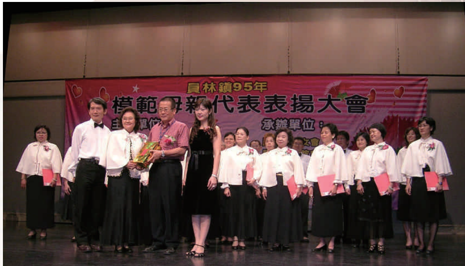
◆員林演藝廳活動（2008）