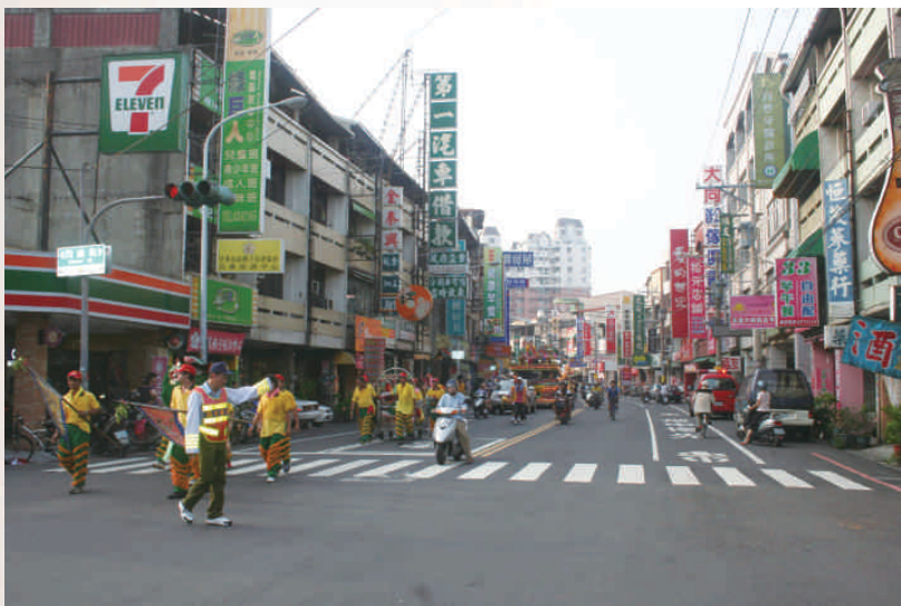
◆南壇宮城隍爺遶境，經南門尾中正路員林家商前2009

2009年南壇宮遶境隊伍浩浩蕩蕩，沿途重要路口皆有義工和員林後憲支援交通，行經處引來路人駐足觀看。這次遶境陣頭氣勢如虹，包括宣導車、彩牌車、開路鼓員林大鼓北管陣、和美花車、社頭張厝村振興館獅陣、南壇宮太子元帥、總指揮車、花車、南壇宮出巡五神尊、義安堂、燕秀花車、八家將、員林飛鴻館龍