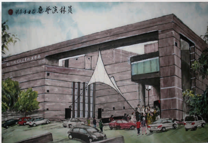
畫家蔡水鎮作品「員林演藝廳」2009