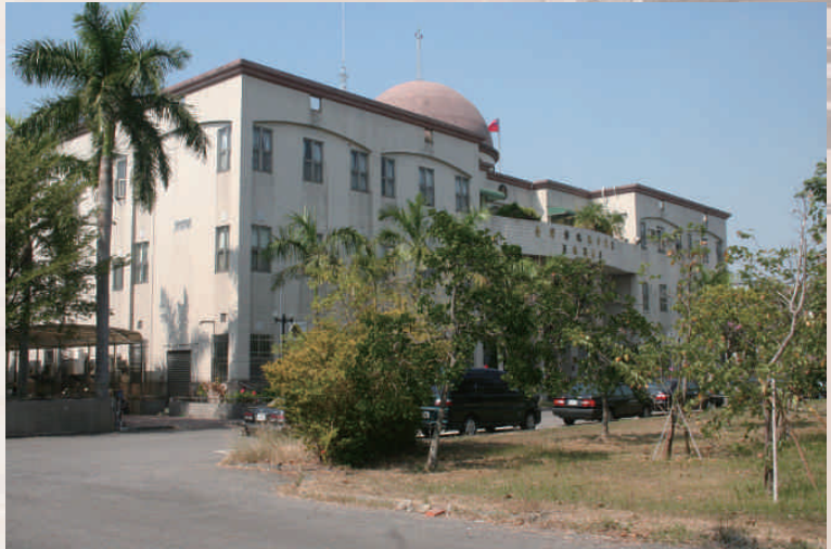
◆員林簡易法庭

其中員林簡易法庭土地乃原麻處員林廠舊址，員林家商南面，簡易法庭後方是法院宿舍，1998年在簡易法庭增設彰化地方法院第二辦公處所，將民事執行處與觀護人室等單位遷入辦公，2001年第二辦公大樓設立少年及家事法庭，彰化縣環保局補助設置空地環境綠化樹林，植栽樹種及鋪設草皮改善空氣品質。