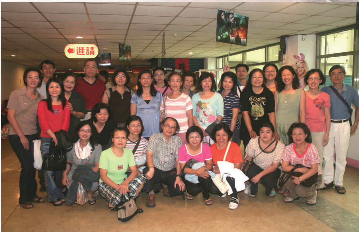
◆員林演藝廳志工隊（楊銘欽攝2008）

Connection 音樂節。十二月臺灣戲劇表演家劇團《男人幫—霸王卸甲》、漢聲國樂音樂會、陳冠宇鋼琴獨奏會、江富美兒童舞蹈團、彰化青年管樂團秋季巡迴音樂會舞曲精選、張正傑大提琴獨奏會、Innovation三重奏之夜。有許多演藝廳常客表示，能在國際級演藝廳欣賞高級節目演出，可以「頓跫印手印--掛保證」，場場皆為美的饗宴。