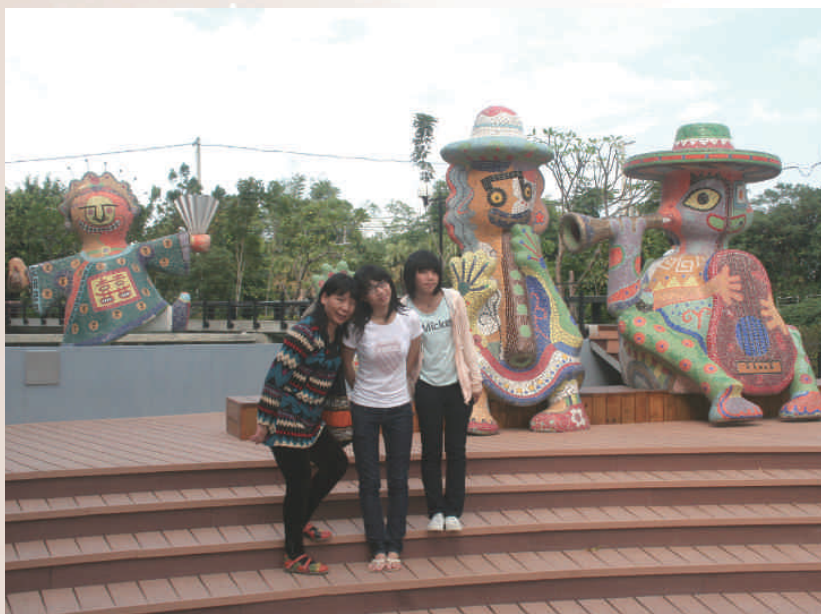
◆員林演藝廳戶外藝術廣場

嶄新的演藝廳引起各界矚目，許多高級演藝團體爭相到此展演。表演廳入口處牆壁上，掛著一幅長條型彰化風光圖，經常引起民眾駐足仰望。表演廳以大型音樂、戲劇及舞蹈表演為主，觀眾席分為一、二樓，寬敞縱深的舞台，裝置複雜的燈光佈景變換，營造多元的視覺效果，加上優質的音響效果，展現國際水準的演藝廳，帶動文化藝術發展。員林鎮內靜修國小、員林國小、育英國小、大同國中等音樂舞蹈團隊，年度經常申請到此演出，所謂「英雄出少年」，員林青少年才藝多，每次演出往往出現「做戲的欲煞，看戲的毋煞」的情景呢！