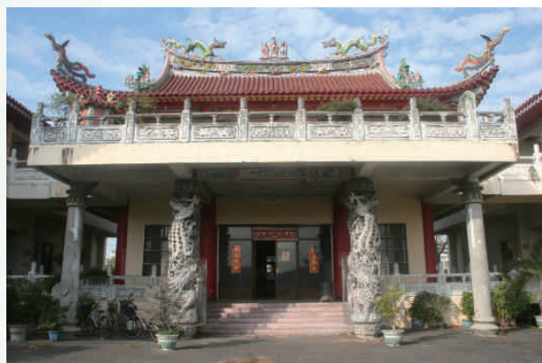
◆員林鎮溝皂里有慶堂張氏家廟