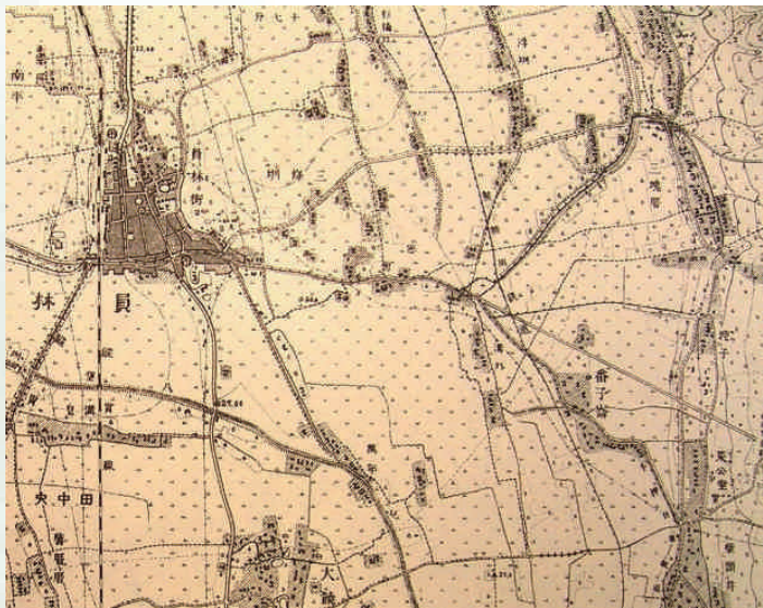
◆員林街古圖1904

員林這塊40.038平方公里的城鎮，宛如彰化縣第二顆眼睛，自古居於南彰化生活中心，位在東經一百二十度、北緯二十三度，距八卦山麓3.5公里，海拔二十五公尺，縱貫鐵路及台一線公路過境。屬亞熱帶季風氣候，氣候溫和怡人，夏秋常有颱風侵襲，帶來豐沛雨量。員林平原為八堡圳灌溉區，物產豐富，自古以水稻為多，日治時期的水稻、芎蕉、椪柑、蘭草加工、食品罐頭等產量豐富，今日以水稻、楊桃、荔枝、龍眼、芭樂、葡萄等農產品為主。