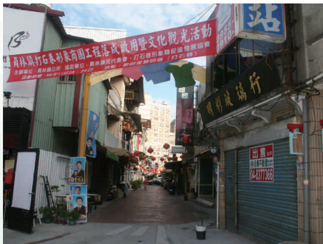
◆打石巷西端入口「國旗台」舊址，約在今黎明巷與民生路交叉口明彩玻璃行前