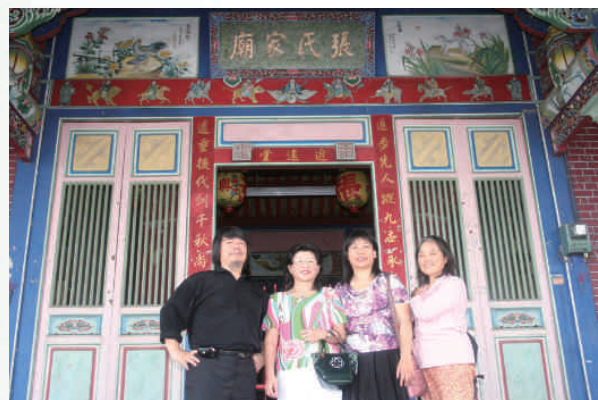
◆員林鎮大明里追遠堂張氏家廟