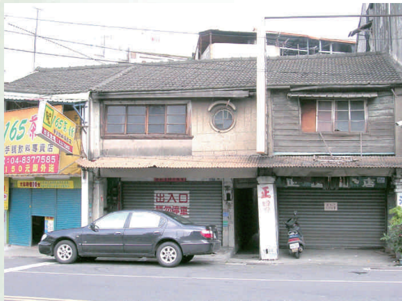
◆日治時期員林輕便車車路口站今貌

惠來厝原屬員林街，戰後獨立為惠來里，地形略呈上窄下寬的梯形，境南農田陸續成為工廠用地，1965年出現太平洋食品廠，還有德利罐頭工廠、大通油脂公司、總源沙拉油廠等，尤其是總源沙拉油廠製油時，對於大豆等雜糧需求量大，1980年代，在鐵路旁南平庄興建的員林立庫，多半倉儲總源沙拉油廠與泰山沙拉油廠的大豆，在員林車站還設有窄軌的五分仔鐵軌直通總源沙拉油廠房。1983年中山路民生地下道開通後，雖然連接員林西區進入員林街通道，卻影響西門腳道路暢通，導致西門腳商機沒落。