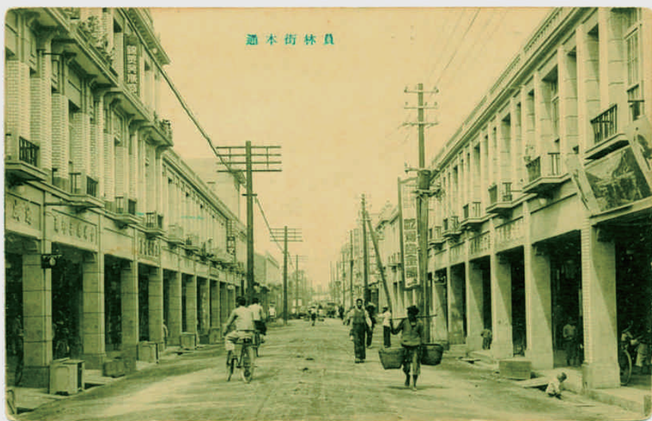
◆日治時期員林街本通，今中正路

戰後從員林街析分獨立為光明里，境內光明街北用竹子搭建的攤販聚集，服飾店、小吃店、生活必需品店等，一家接一家，地方俗叫「竹管市」，後近音雅化稱「竹廣市」，文化戲院曾設在此，約在廣安宮附近。地方耆老回憶，約1980年代左右拆除，當年鎮公所商家攤販佔用道路與私人