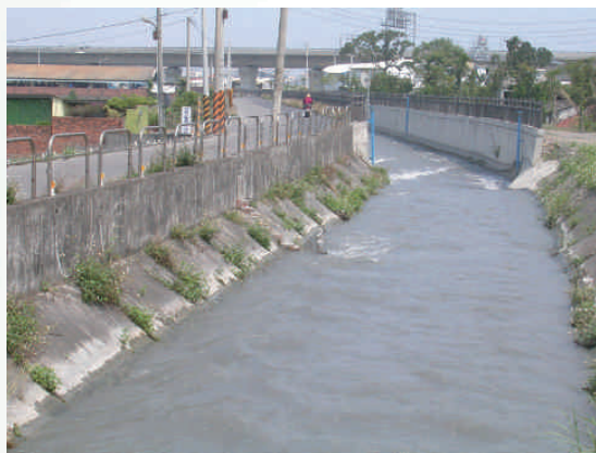
◆八堡一圳大饒段匯入萬年沈砂池後分流

濁水流經社頭入員林火燒庄後分流，在萬年庄與大饒庄交界處設「萬年沈砂池」，濁水經池東分閘門入池，初篩垃圾與漂浮物，閘門水流經階梯式沙洲，沈殿濁水中的沙粒、雜質，肥沃的濁水溪水經閘門後分流，一條北流貫穿員林街，經北門接大庄圳；沈砂池另一條經六個閘門西流，接隆恩支圳後匯入大庄支圳。