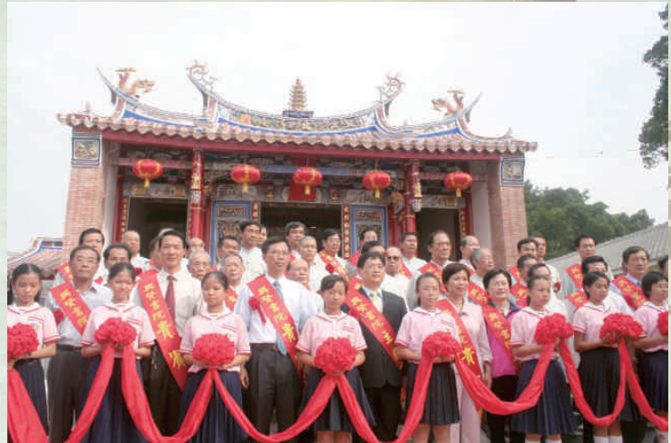
◆興賢書院重建入火安座2005

林仔街廣寧廟後方不遠處，員林街外的八堡圳東畔，原本只是綠野平疇，武東保、武西保、燕霧下保等地方文人士紳集資，1807在圳溝旁建文昌祠，設立興賢社。1823年白沙坑曾拔萃等修築文昌祠，1832年周璽《彰化縣志》記載彰化區社學包括興賢社，後來興賢社擴大教育規模，向官府登記擴設為興賢書院，書院內外諸多文人結社，他們集資置祀田，有幾份地契紀錄大員林區文人的故事。