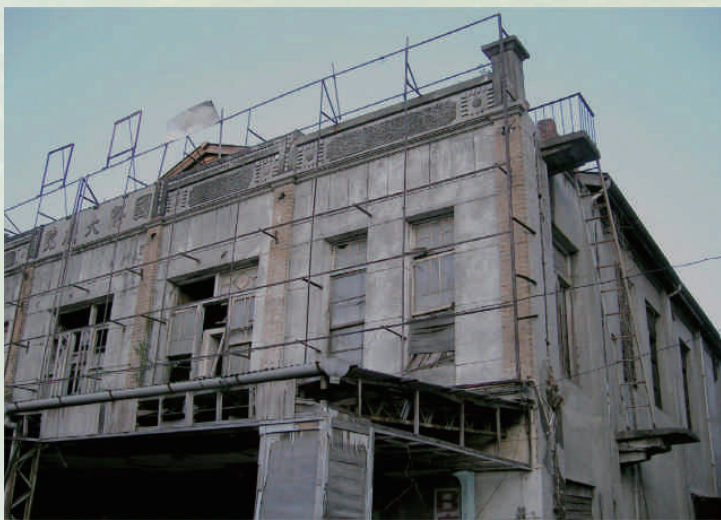
◆員林國際大戲院有七十幾年歷史，圖為2007年拆除前模樣，2009年改建為加油站

惠來里境內小地名有惠來厝、西門腳、車路口、鐵路、天橋、教會。惠來里因古聚落「惠來厝」得名，境內北端惠來厝聚落先民入墾早，惠來街東面多處仍屬農業用地，1905年台鐵貫穿境內。「西門」約在今日的民生路、中山路、新生路交會處一帶，日治時期員林街第一家戲院「員林樂舞台」在西門腳鐵軌旁落成，成為員林郡重要的社會娛樂據點。1937年成立的