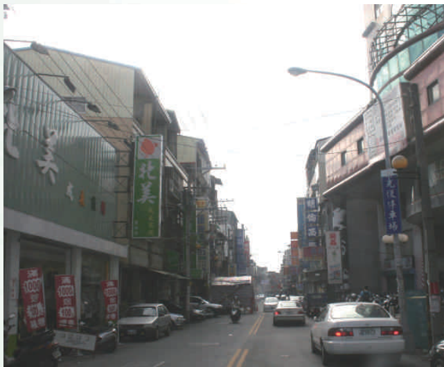
◆右為閒置多年的惠來廣場