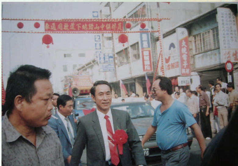
◆員林鎮中山路地下道1983年啟用

戰後惠來里境內出現多家醫療院所，還有惠陽宮、基督教真耶穌會員林教會，現今依舊以北面的商業發展最活絡，尤其是惠來街、中山路多家醫療院所聚集，例如協和、宏仁、仁愛中醫院等。惠來里東以光明街與黎明里為界，西以中山路與三義里交界，南以八堡一圳和溝皂里相連，北以中山路與中山里相通。