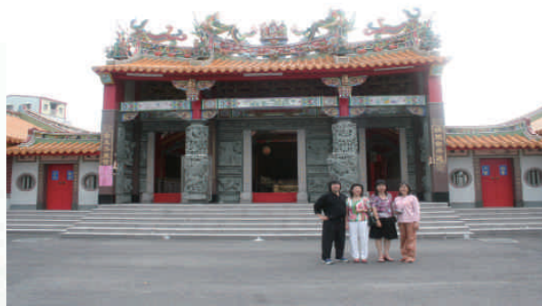
◆員林鎮大饒里有義堂張氏宗祠

1866年廣興庄（溝皂里）張高兄弟向新興村朱姓父子買田產八分多，中引者用毛筆寫下地契，土地位址約今員林中央里與永靖崙子村交界的九分巷一帶，那時以清水溝、濁水溝（八堡圳）、王爺田、張家田宅和朱家荖園為界，可知當時的聚落位在圳溝附近，田園與住宅相近，已栽植荖葉園了。朱家不得已需出售田產，依地方習俗先盡問房親兄弟叔侄人等均不受時，方由中引者介紹買主並簽署地契。朱家茅屋周邊植有刺竹叢、檳榔樹、荖葉樹、果樹，還有水井、茅廁等均一同出售，最後由中人、知見人、在場人、代筆人畫押，銀元收訖立即到現場踏明界址，雙方買賣完成，各執田宅契為憑。這份田宅