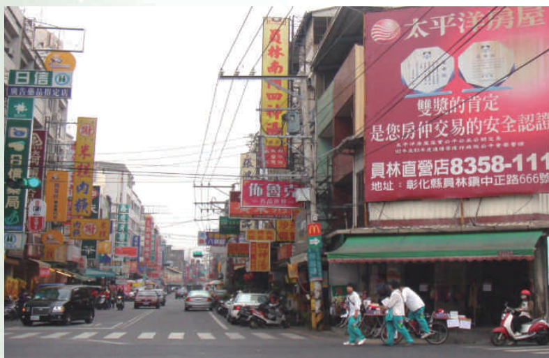
◆員林南門尾中正路與南昌路交叉口情景

民生里境內小地名有南門、東門、大圳溝、南門尾、十炭仔、家職、帝爺廟、十炭仔。其中「東門」因位在員林街東面入口而得名，在八堡圳頭厝東門橋附近，約今日民生路、萬年路、員水路、育英路、員東路等叉口處，晚近道路拓寬，又叫「八條通」，今許記溫州