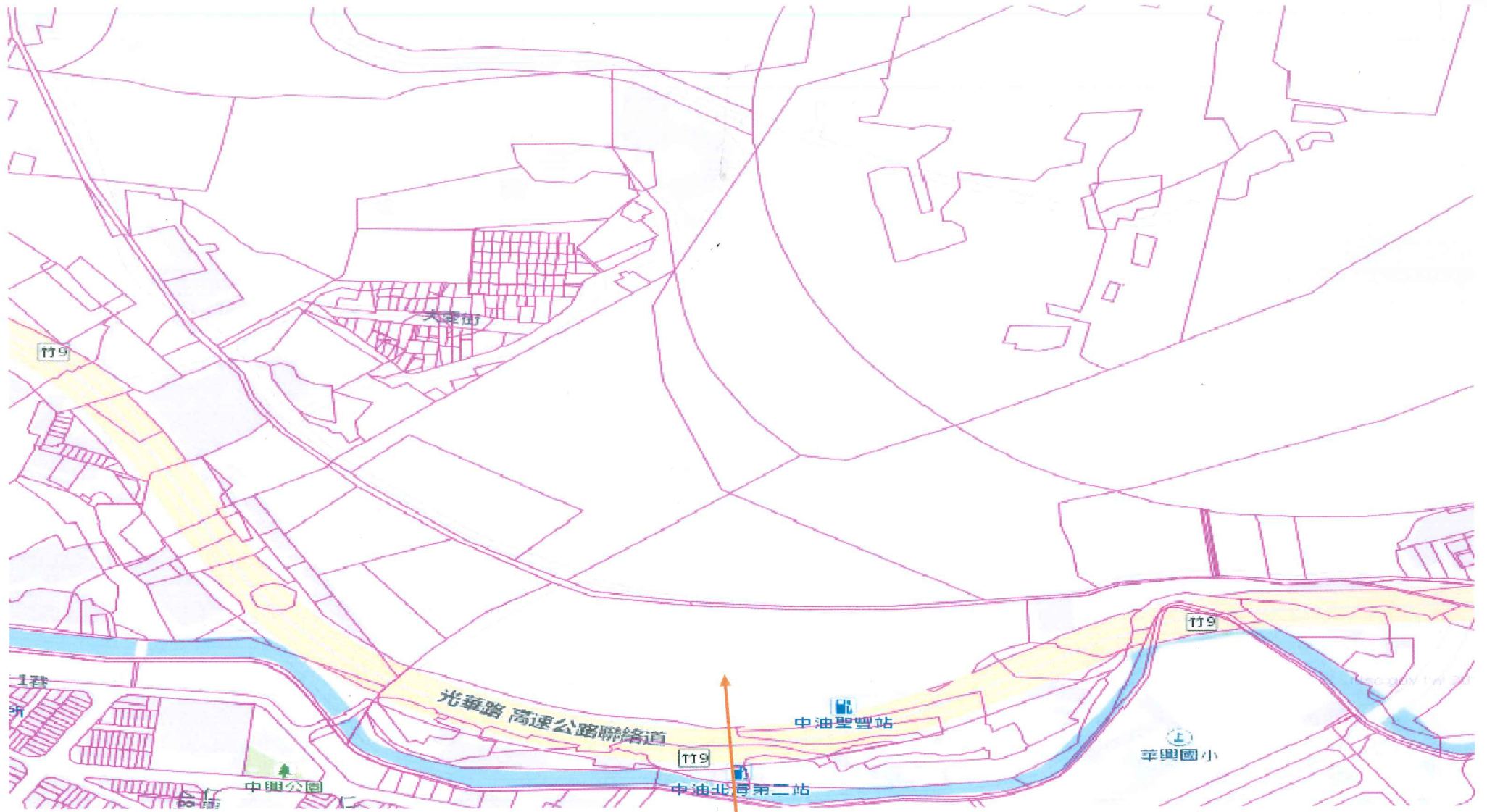
番子湖段中番子湖小段第 24 地號