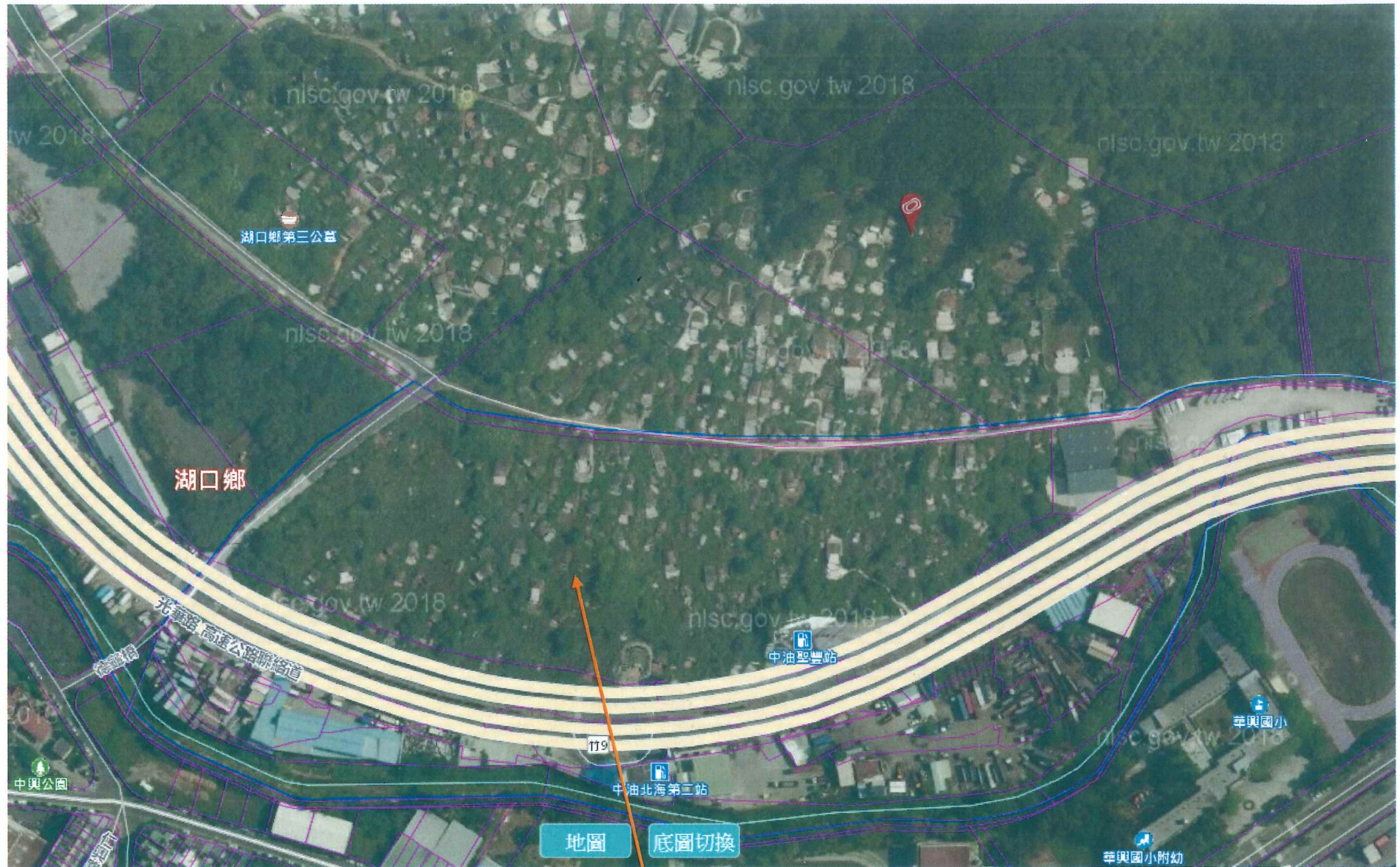
番子湖段中番子湖小段第 24 地號