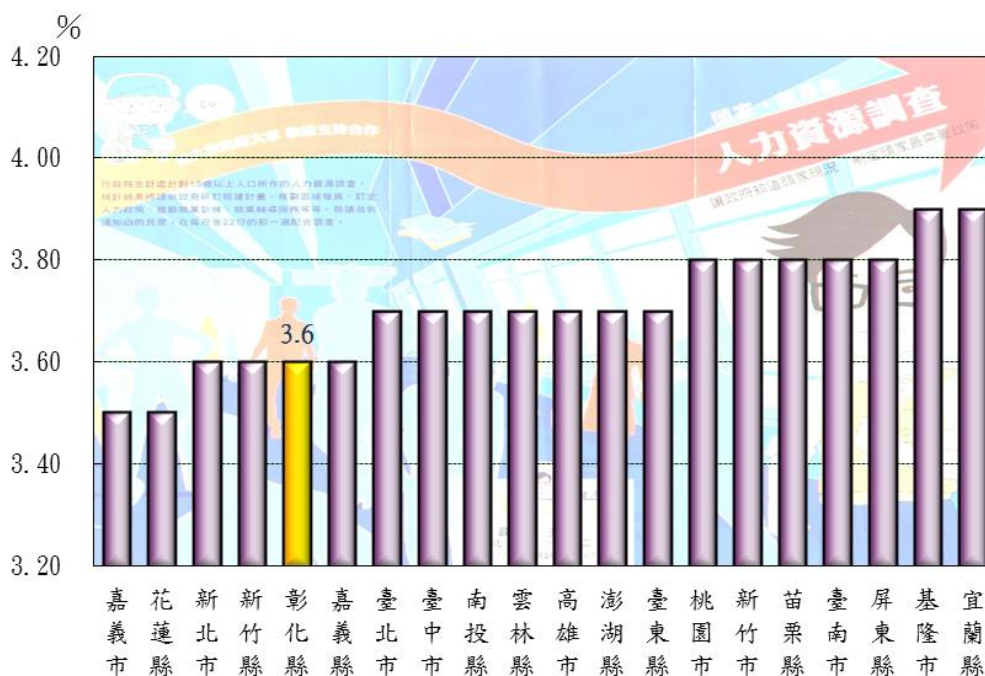
圖二 臺灣地區104年上半年失業率

本縣 104 年上半年失業率為 3.6%，較 103 年下半年 3.9% 下降 0.3 個百分點，為臺灣地區第 2 低，僅較嘉義市及花蓮縣為高；男性失業率為 3.4%，較 103 年下半年 4.3% 減少 0.9 個百分點，女性失業率 3.8%，則較 103 年下半年 3.4% 增加 0.4 個百分點。