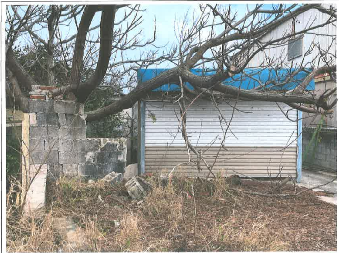
說明：占用物-空心磚平房、鐵皮車庫