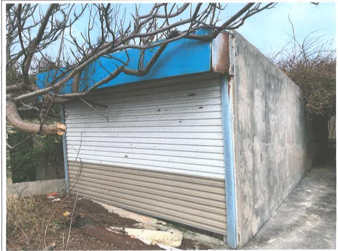
說明：占用物-牆內庭院、鐵皮車庫