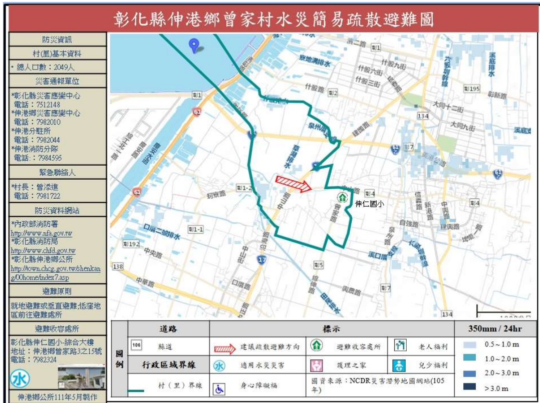
附圖一、伸港鄉各村里水災疏散避難地圖