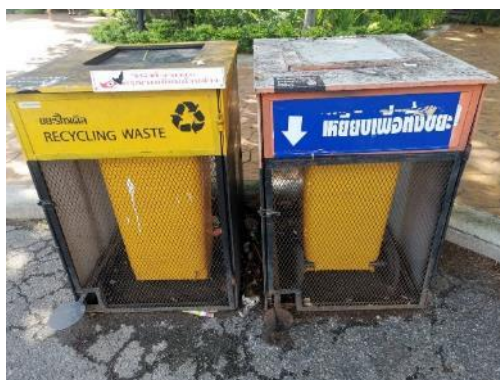
↑ 園區垃圾桶防止動物破壞的設計