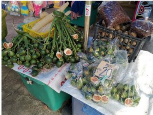
↑ 周邊平價市集-泰國檳榔