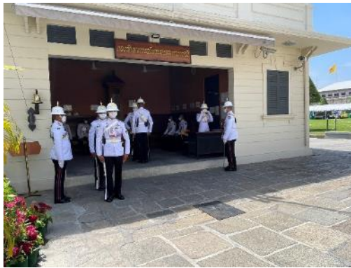
↑ 大皇宮皇家衛兵交接