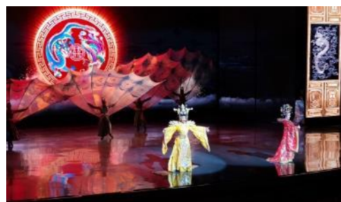
↑ 結合東方文化表演