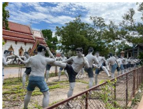
↑ 泰拳雕塑裝置藝術