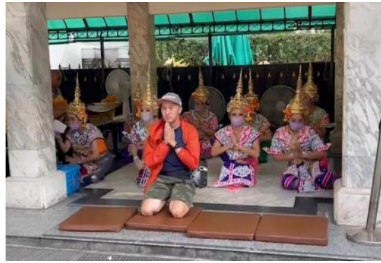
↑ 聞歌起舞幫你進行許願或者還願的儀式