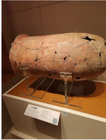
↑ 放置骸骨的膠囊狀陶器