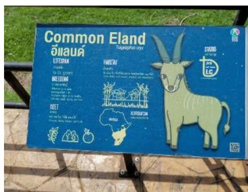
↑ 園區動物介紹資訊