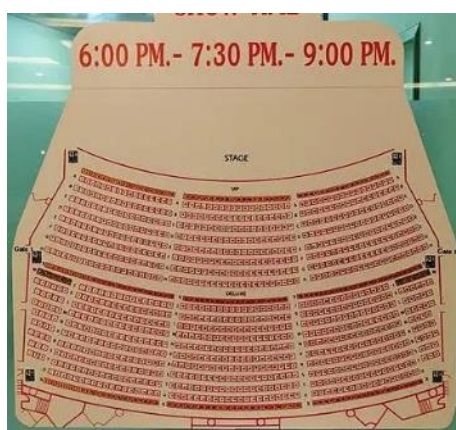
↑ 半圓形空間設計座位區

第三性別工作者在泰國政府支持下得以揚眉國際，在台灣政府也鼓勵具藝術表演或創作的人才投入，街頭藝人讓各大景點添加可看性，本鄉森林公園的前身是溪州舊糖廠，本所爭取設立為森林公園，森林公園是彰化縣老樹最密集的公園，經前幾年改建一個舞台區，可以讓街頭藝人來表演，周邊可以設立特色市集，進而行銷溪州景點，帶來更多的觀光人潮。