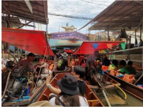
↑ 水上各式船隻雍塞的情形