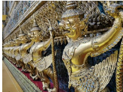
↑ 皇室金翅鳥的建築特色