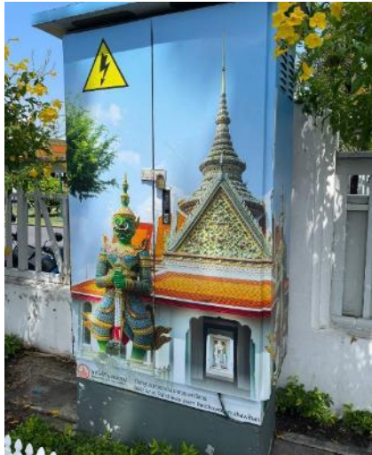
↑ 大皇宮外牆變電箱美化設計