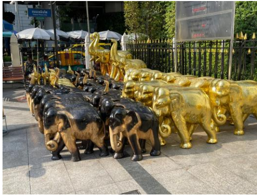
↑ 各式大小的還願大象