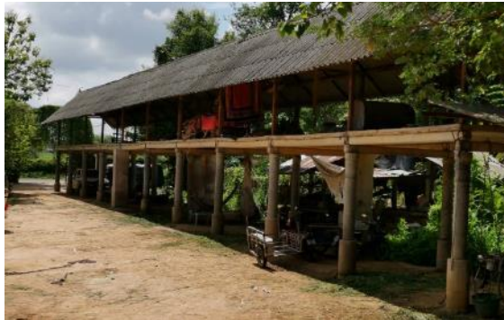
↑ 大象休息區高架建築