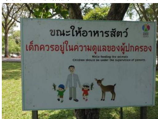
↑ 提醒小孩餵食需家長陪同告示牌