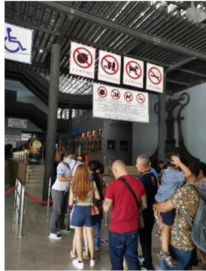
↑ 禁止攜帶榴槤進入劇場