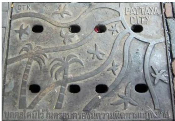
↑ 徒步區地方特色水溝蓋

曾經聽老長輩說，於日據時代期間，溪州設立製糖所，通稱溪州糖廠，當時居住人口多，街上商店林立，進駐了多間有色茶室，雖然為溪州帶來繁華的夜生活，但不免造成許多治安問題，戰後隨著溪州糖廠的遷移，傳統茶室已成歷史，隨著時代的變遷，溪州如今是個農業鄉村，街上還是看不到遊走法律邊緣的深色場所。