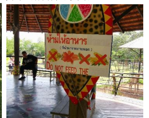
↑ 禁止餵食其他食物公告