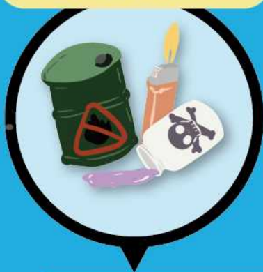
易燃與毒化物容器