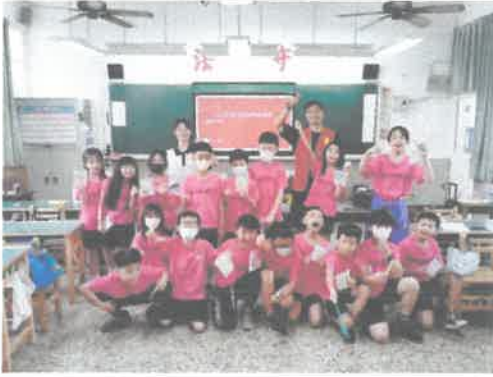
學校連結: 敬老宣導