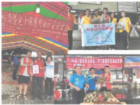
企業、慈善會及社區連結:端午肉粽