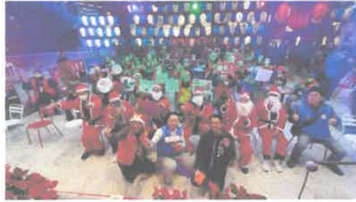
逢甲觀光夜市管委會與商家特於昨日邀請華山基金會50位獨居長者前來逛夜市、品音樂。