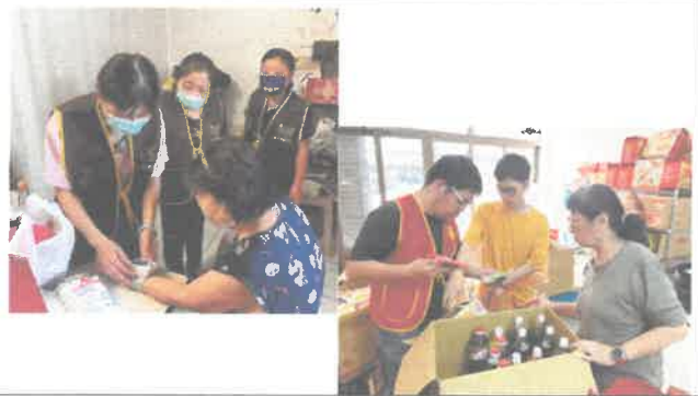
義工連結: 整理物資、到宅訪視等