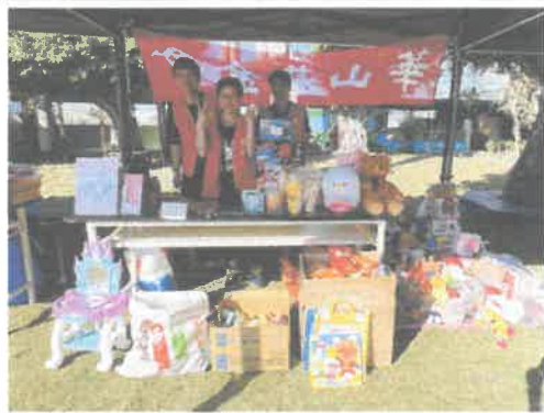
公益擺攤:學校校慶