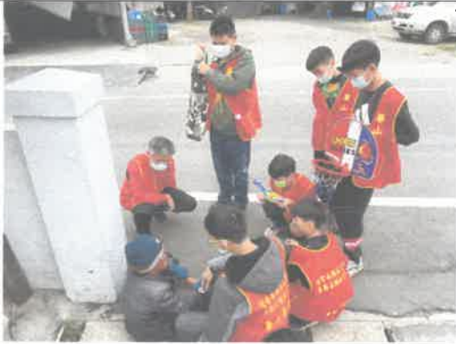
學校連結: 到宅訪視