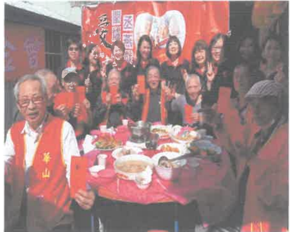
愛心企業為往生阿伯圓遺願，陪獨居老寶貝圍爐迎新送舊。