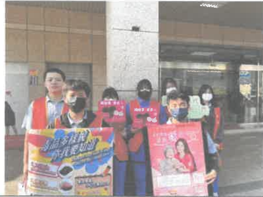
學校連結: 街募發票