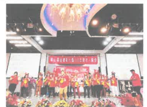
促進長輩社會參與:愛老人餐會