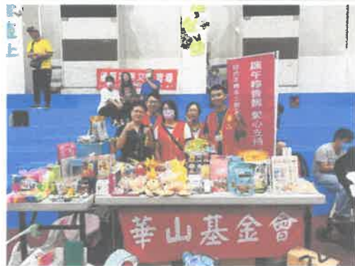
公益擺攤:公部門活動