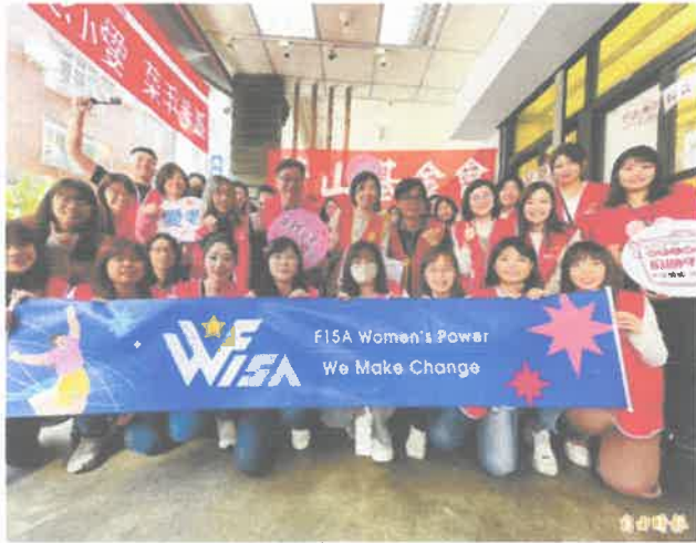
台積電15A廠送年菜給長輩。

【記者許金鳳/台中報導】下週就是農曆春節，讓很多老人也給感受到社會溫暖，台積電15A廠