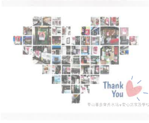
店家連結: 公益海報張貼