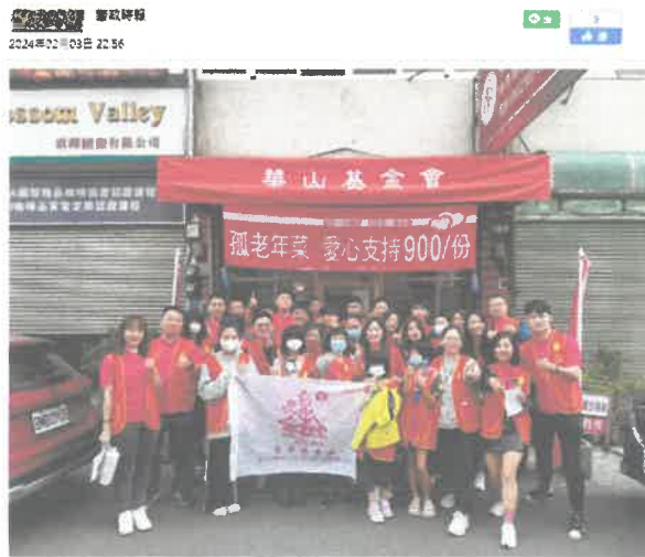
台中扶輪Uncle「齊募愛心」| 捐助華山長輩300份年菜