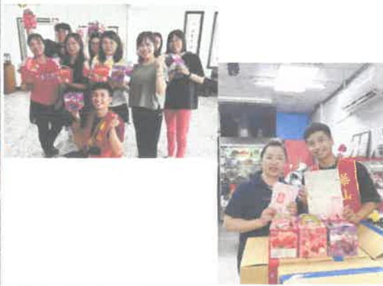
公益義賣+快閃活動