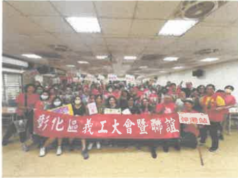
義工連結: 義工聯誼活動