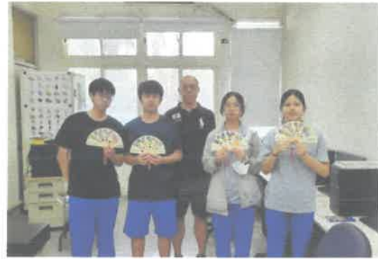
學校連結: 布扇手作物祝福