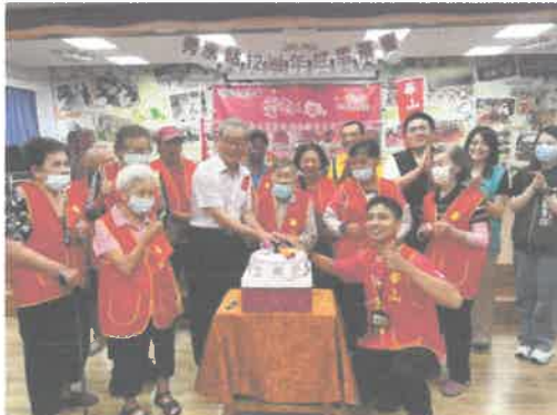
促進長輩社會參與:秀水站感恩茶會