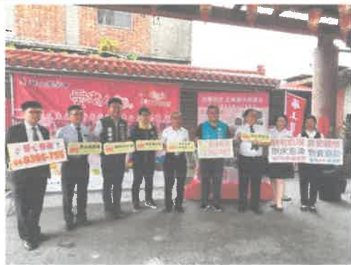
公益造勢媒體活動