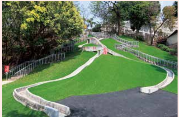
長長的溜滑梯，是大家的童年回憶~