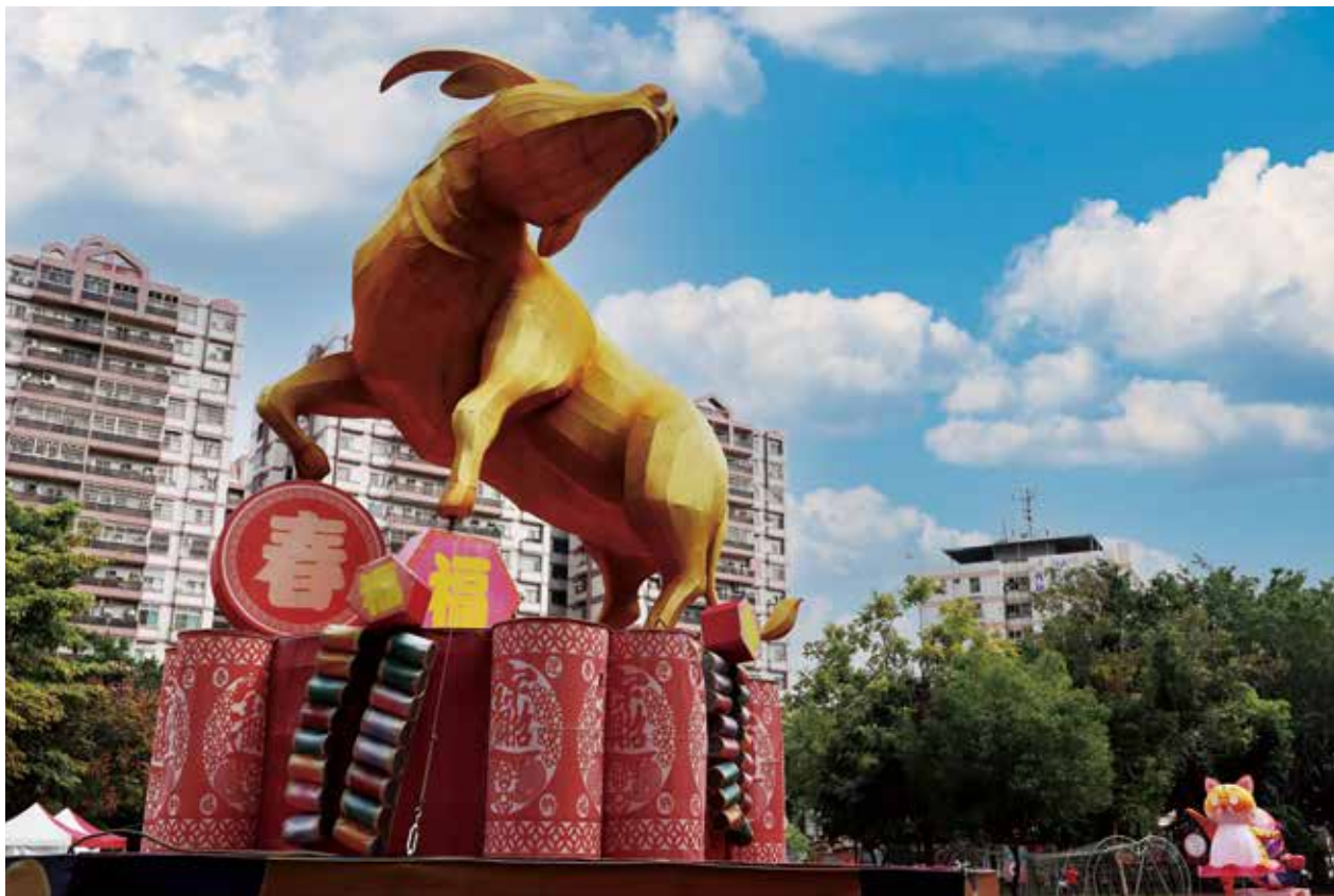
萌虎燈向牛年主燈揮手道別，迎接嶄新的一年！