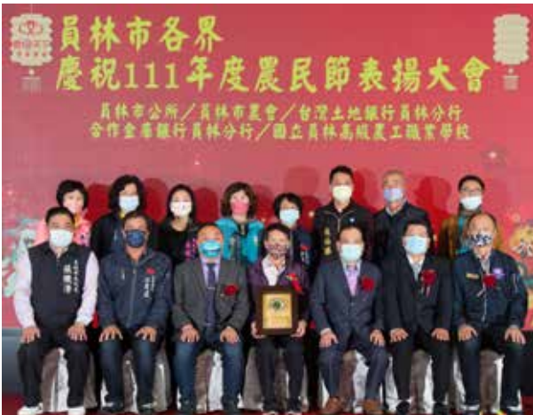
頒獎勉勵傑出農友，期許日後帶動本市優質農業環境。

去(110)年員林市農產業成績亮眼，員林市公所於1月22日上午與員林市農會、台灣土地銀行員林分行、合作金庫銀行員林分行、國立員林高級農工職業學校籌組委員會共同辦理「農民節表揚大會」，肯定農民對生產優質農產品及推廣上的貢獻與辛勞。