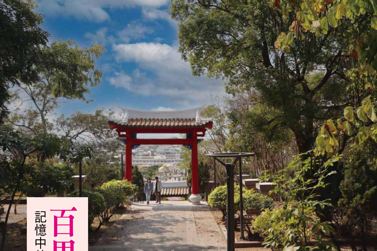
留下的不只是遺跡，還有我們與土地間的連結。