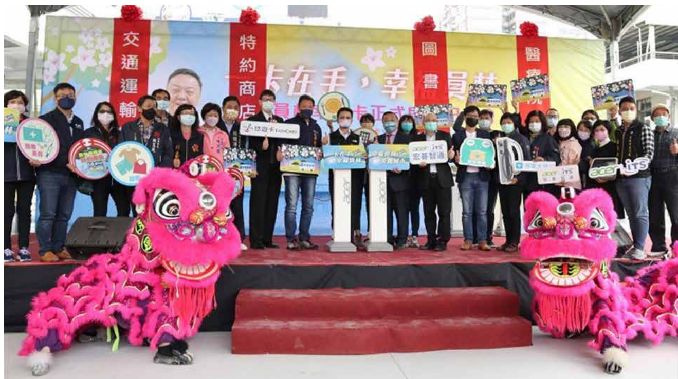
交通運輸、特約商店、圖書館、醫院等，一張幸福卡即可暢遊員林。

市公所為方便市民辨識幸福卡特約商店，特別設計專屬標誌並製作成貼紙及壓克力提供給商家，發行幸福卡不僅讓市民更幸福，也協助把商機留在員林，共創市民及在地業者雙贏遠景。