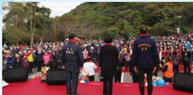
在縣長及市長帶領下，元旦升旗大成功！