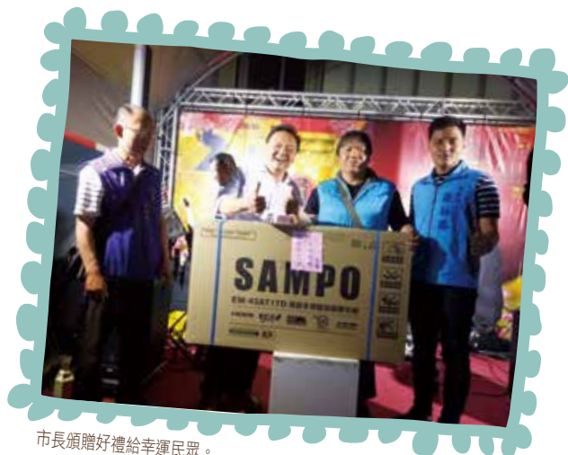
市長頒贈好禮給幸運民眾。

員林位於彰化縣中部偏東，交通便利、適宜居住，自清朝起便是臺灣的工商重鎮，更因為地質肥沃、雨量充沛而有穩定的農業發展，各業興盛、人口數眾多的員林曾是全臺第一大鎮，自 104 年 8 月 8 日改制員林市後，更為南彰化的經濟及文化中心。