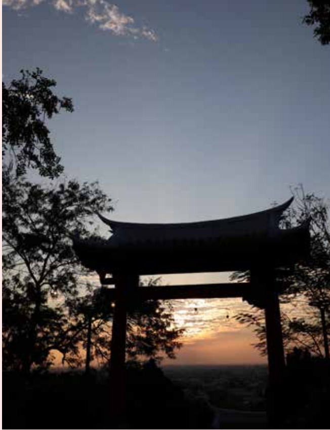
餘暉下的鳥居，美不勝收。

從何而來、又該往哪去，一個地方的永續仰賴人文歷史的價值。日據時代的神社主殿已不復見，但周邊的鳥居、石燈籠、高麗犬石雕、銅馬等，與民國時代改建的忠烈祠仍是重要保存歷史建築，雖然經過歲月的洗禮，難免有些老舊的痕跡，但也因數十年的光陰沉寂，園區尚保有原本的樣子，近年經員林市公所、參山處審慎評估，並與在地居民共同討論後，進行歷史建築修復。遊憩設施的部分，則改善老舊破損景觀設施，增設共融式的兒童遊具及體健設施，並完成入口廣場、植栽綠美化及照明設備的整建，盼百果山再次成為大家校外遠足、情侶約會、散步健走的觀光景點，恢復昔日榮景。