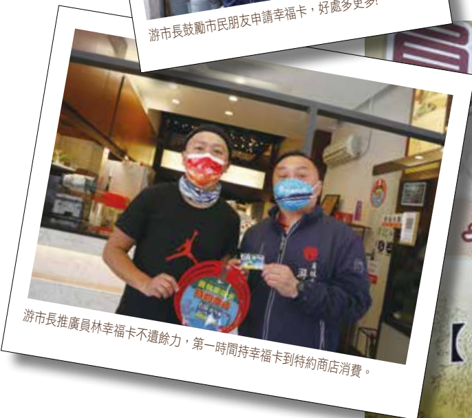
游市長推廣員林幸福卡不遺餘力，第一時間持幸福卡到特約商店消費。