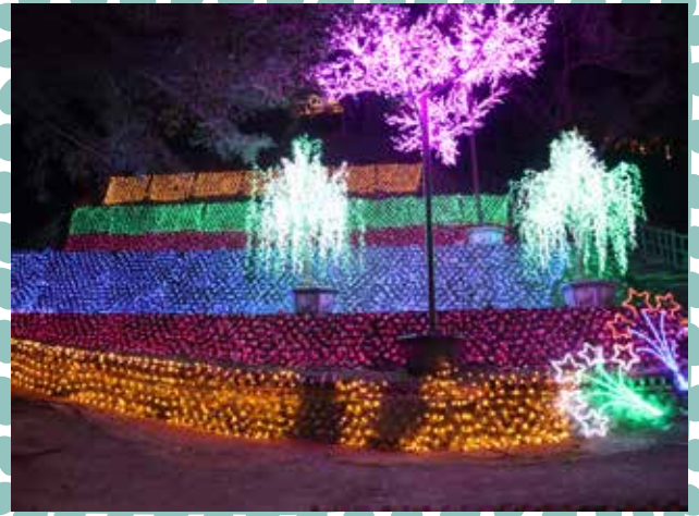
五顏六色的光環境，點亮百果山公園！

延續首屆燈會盛況，「2022 員林燈會暨元宵節晚會活動」於員林舊百果山遊樂區及員林公園兩個燈區展出。主燈高 5 公尺虎來寶以百果山溜滑梯與可愛萌虎造型為設計主軸搭配燈光及音樂更顯璀璨，另有傳統花燈與光耀員林打卡牆提供夜間拍照打卡及沿路光環境布置等點亮百果山，不僅帶給遊客們炫麗的光影盛宴，更因眾多人潮湧入，讓百果山風華再現。