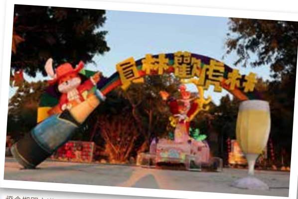
燈會期間充滿活潑、熱鬧氛圍的公園，讓百果山再現風華～