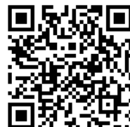
員林幸福卡線上申請

「員林幸福卡」線上申請已正式開通使用，預計發出10萬張員林幸福卡，相對於發放一次性現金，員林幸福卡更可結合多項在地資源、活絡地方經濟發展，提供長期的社會福利，讓員林成為幸福美好又兼具智慧與科技的都市。