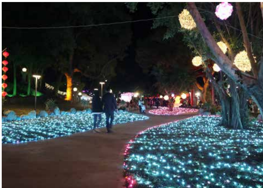
點燈後的百果山，別有一番風味。