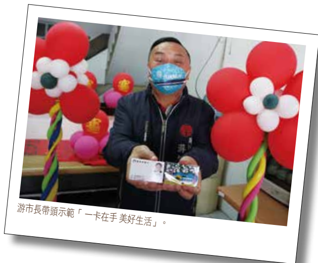
游市長帶頭示範「一卡在手 美好生活」。

隨著行動上網已蔚為主流，員林幸福卡除實體卡片外，還可綁定銀行做行動支付，透過小額支付功能，讓市民朋友輕鬆享受到生活便利性，讓市民生活智慧化、福利數位化。