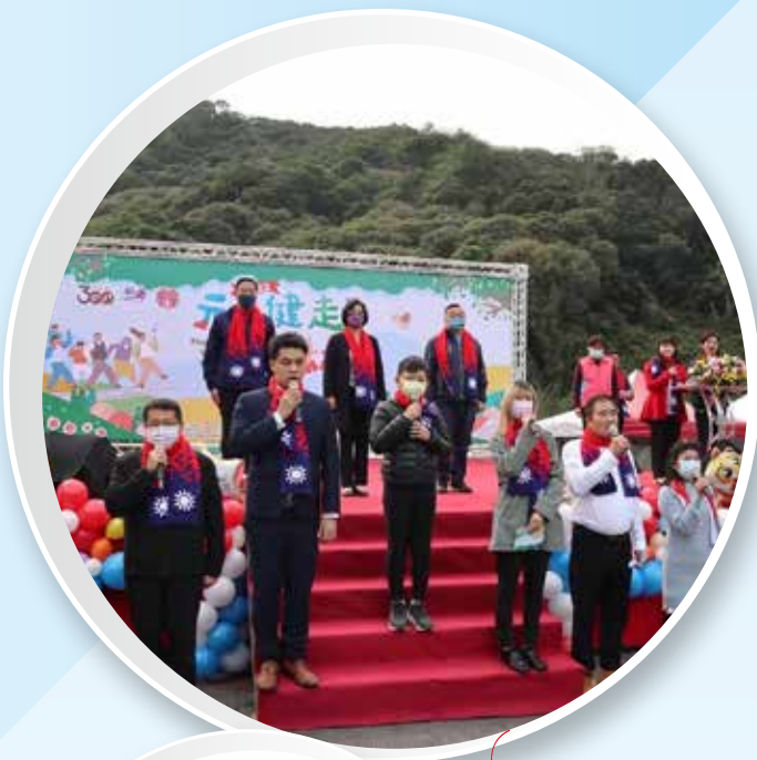
縣長、市長及代表會主席升旗合影。

為迎接彰化縣建縣 300 週年，彰化縣政府與員林市公所於元旦上午在員林運動公園隆重舉行「『彰化豐采、榮耀三百』～2022 元旦健走在員林」，吸引上千名民眾齊聚參加元旦升旗典禮及健走活動，共同分享新年喜悅。