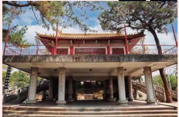
二戰後，員林神社本殿拆毀改成「浩然台」，做為忠烈祠之用。