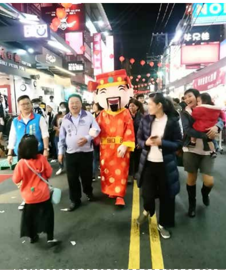
市長與財神爺遊街，祈求員林來年平安、豐收。

員林位於彰化縣中部偏東，交通便利、適宜居住，自清朝起便是臺灣的工商重鎮，更因為地質肥沃、雨量充沛而有穩定的農業發展，各業興盛、人口數眾多的員林曾是全臺第一大鎮，自 104 年 8 月 8 日改制員林市後，更為南彰化的經濟及文化中心。