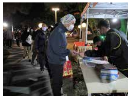
公所發放元宵燈籠，市民朋友樂不思蜀～

活動副燈區除員林公園 6 座燈區及浪漫員林的心型光廊外，三角公園、鳳梨公園等皆設有燈區，另外萬年路三段的 3,500 盞彩繪燈籠，在燈光投射下讓人著迷陶醉；員林穀倉與警察故事館光環境營造絢麗的視覺體驗；從員林火車站為起點，沿途民權街、光明街、三民街等以各種不同特色光環境打造絕美燈海隧道，讓員林的夜空越夜越美麗。