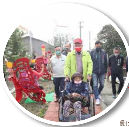
優化市容，讓環境更加友善長者。