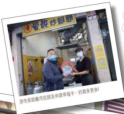
游市長鼓勵市民朋友申請幸福卡，好處多更多!