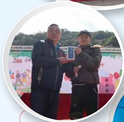
現場辦理摸彩活動，由市長頒獎給幸運民眾。

彰化縣長王惠美及員林市長游振雄帶領各界代表及參加的民眾一同升旗，歡慶中華民國 111 年元旦，傳達彰化縣民慶祝元旦及迎接新年的喜悅。元旦健行不僅是臺灣迎接新年的特有活動，同時有越來越多民眾將元旦健走作為親友之間相約跨年後第一天聚會場合，本次活動讓參加民眾在 2022 年走出健康、走出好采頭，共同留下美好回憶。