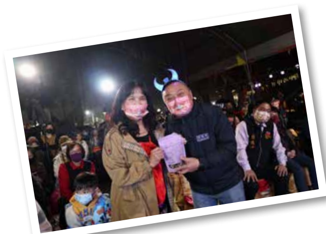
市長頒獎給幸運的市民朋友～

員林市自游市長上任以來，透過「來員林過好年」、「員林燈會」等活動，陪伴市民歡慶春節鬧元宵，大街小巷飄滿年味，洋溢著幸福員林的美好生活。