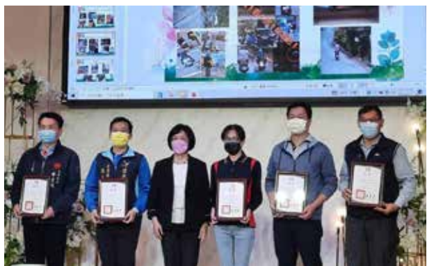
彰化縣長王惠美頒獎給優秀的清潔隊員們！