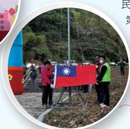
國旗展旗，帶領眾人一同升旗。