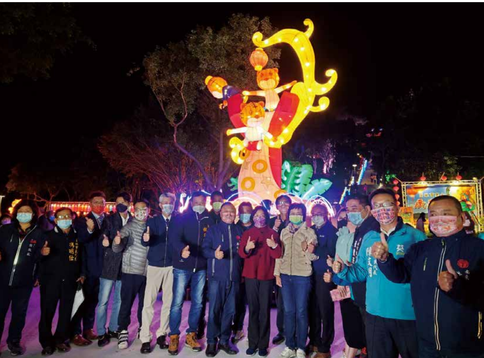
縣長與市長摯邀請大家到員林看燈會～