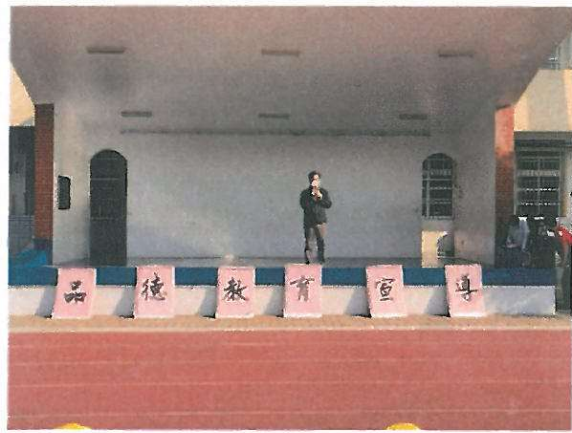
圖一 校長於兒童朝會宣導廉潔重要