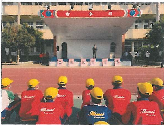
圖二 對全校學生進行案例宣導