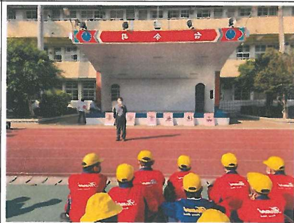
圖四 學生聚精會神聽主任敘述