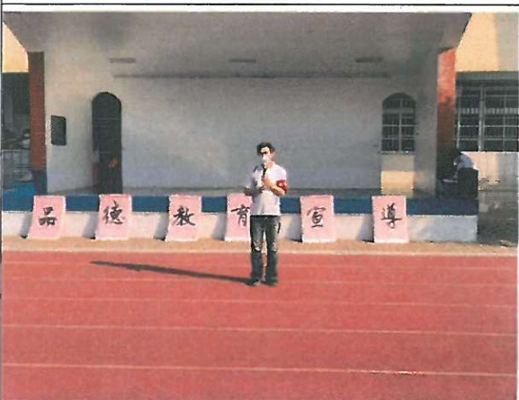
圖五 訓育組長宣導廉潔活動