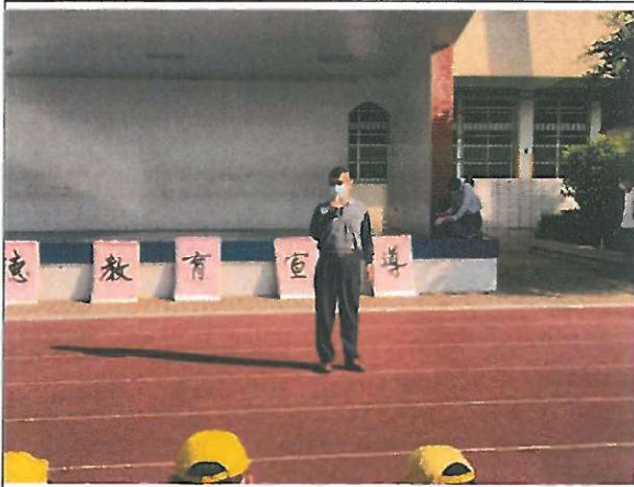
圖三 主任以故事引導學生了解廉潔