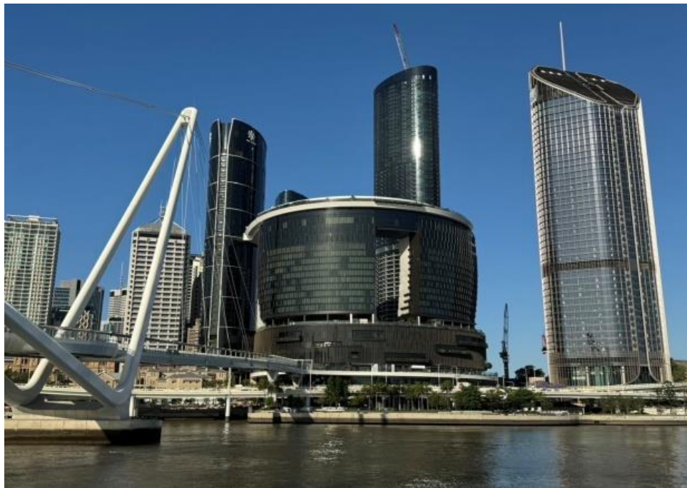
圖 1：體驗市區交通之旅