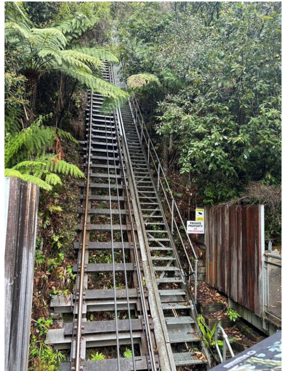
圖 9：自然為主的設施