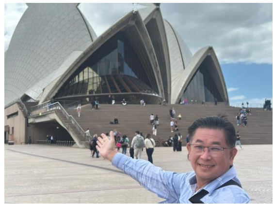
圖 5：歌劇院的長樓梯