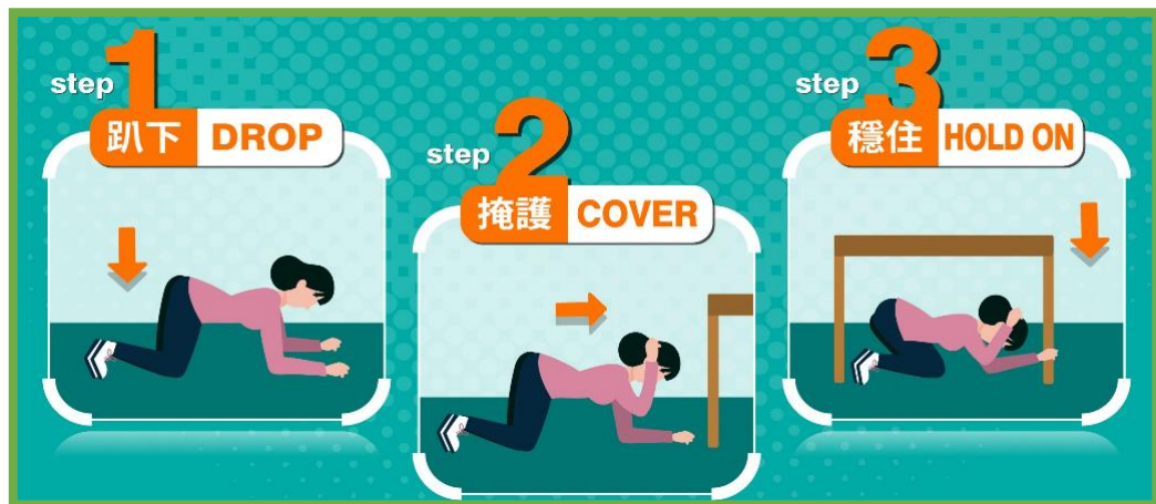
圖 1 地震避難 3 步驟

113年9月20日(星期五)上午9時21分，由交通部中央氣象署透過「災防告警細胞廣播訊息系統」發布「國家防災日地震警報」訊息，請參與演練人員立即進行自主性就地避難演練，即採地震避難3步驟(趴下 Drop【固定 Lock】、掩護 Cover、穩住 Hold on)，避難演練時間約1分鐘。