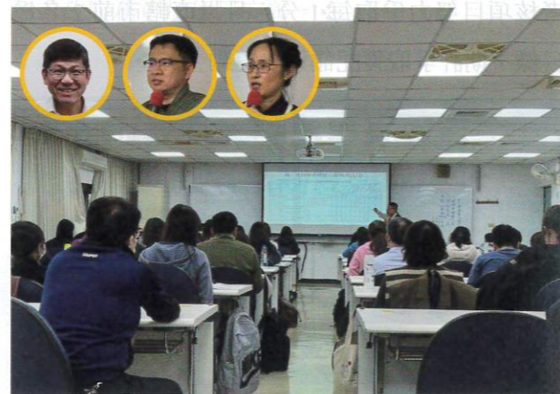
●臺北市府主計處舉辦「性別預算編製與性別統計及分析」研習情景

之課程安排，使同仁對於該等工具之應用及關聯性有較全面性了解，期能助益於政府性別平等業務之推動。❖