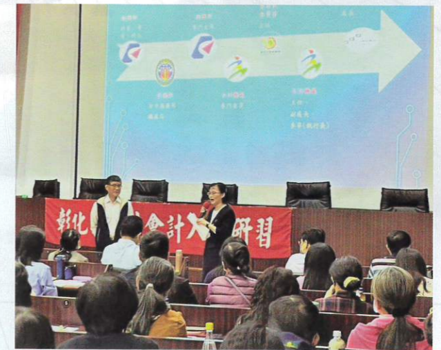
●彰化縣 113 年度主辦會計人員研習情景