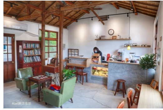
附屬設施紅磚屋-青創進駐

查北斗鎮112年4月份人口數約3萬3,283人，經濟主要以批發及零售業、製造業及餐飲業為主，基地鄰近有彰化縣警察局北斗分局、地政事務所、衛生所、稅務局北斗分局及北斗國中及國小等政府機關單位，有新建住宅聚落、奠安宮廟宇文化及餐飲商業密集地帶，本基地距台1線600公尺及國道1號北斗交流道約4公里，交通極為方便，另距離田尾公路花園僅3公里，地理位置相當優越，發展潛力大。