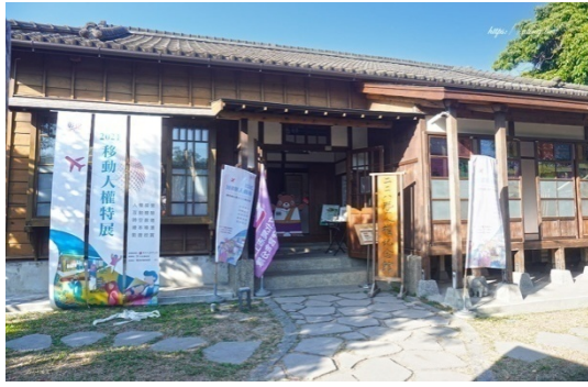
歷史建築北斗郡守官舍 「彰化縣二二八暨人權紀念館」