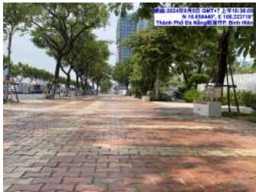
圖一 峴港道路與人行道平整美觀

公共建設及觀光環境創造，其微小、人性導向規劃設計都是作為吸引遊客及觀光策略擬定重要一環，想必鏡峴港城市發展及會安古鎮的觀光環境，對於竹塘鄉目前人行道規劃設計，及大榕公生態園區的觀光環境營造都會有所啟發與借鏡吧。