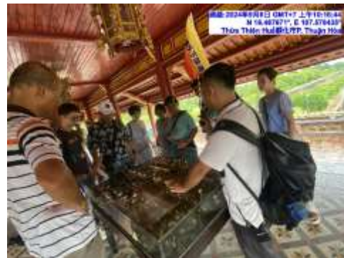
圖七 順化皇城地方故事行銷導覽