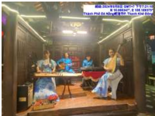
圖十六 老空間越南庭院園料理民俗表演