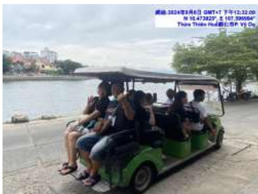
圖十二 電動車定點接駁