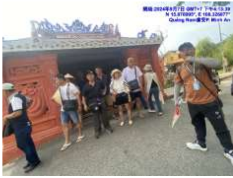
圖八 會安老街文化巡禮導覽