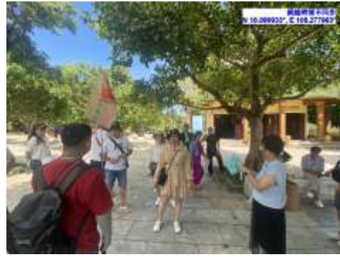
圖九 感應寺宗教寺廟故事導覽