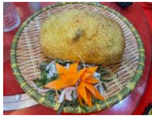
圖十七 會安網紅餐廳恐龍蛋風味餐