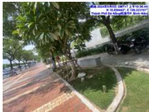
圖二 峴港道路與人行道綠美化