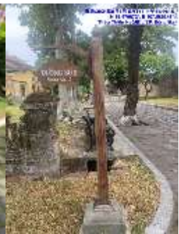
圖五 風景區的景觀椅、垃圾桶、景觀指示牌等設計會結合地方特色