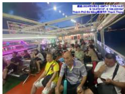
圖十三 仿古畫船遊香江