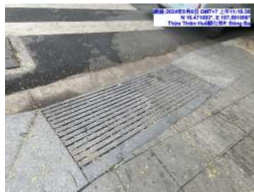
圖四 會安古鎮道路與人行道平順防滑