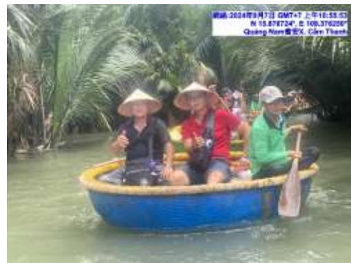
圖十一 竹籃船體驗遊迦南島