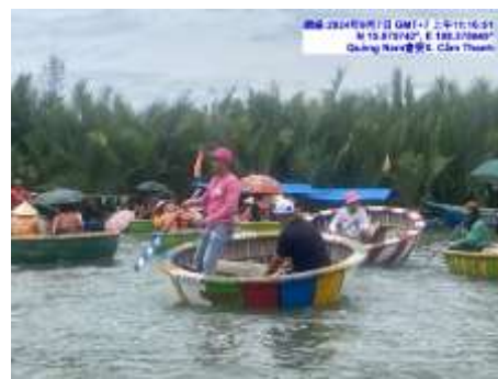
圖十五 竹籃船體驗遊迦南島表演