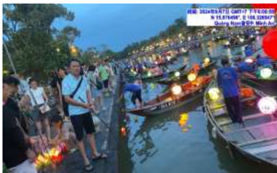
圖十四 會安祈福水燈活動

本次出國考察的另一特色是當地觀光善於運用將不同地貌特色風景、不同地域特色餐及不同地方民俗表演，包裝成地方產業套裝行程，進而變成當地觀光產業特色行程，例如上午竹籃船體驗遊迦南島及中間行程安排樂釣螃蟹，中午安排迦南島海鮮火鍋，下午遊會安古鎮後晚上放祈福水燈…等。竹塘鄉屬觀光資源較匱乏地區，如能運用九龍大榕公特殊自然景點，串聯濁水溪水岸遊具，結合竹塘鄉地方產業餐或民俗表演，創造地訪產業旅遊套裝行程，將是另一條促進產業、帶動觀光藍帶的可行性高之規劃。