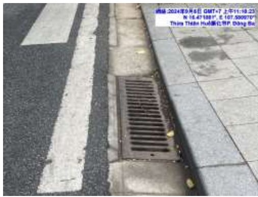
圖三 會安古鎮下水道格柵蓋板平整