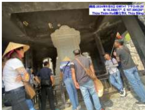
圖六 啟定皇陵歷史景點介紹導覽

本次出國考察行程中，由旅行社結合在地團隊覽員，善於信手拈來介紹歷史故事結合觀光導覽，以增加考察行程趣味與豐富性，例如順化啟定皇陵地方歷史故事，會安古鎮自然景色導覽..等，均可應用在竹塘鄉大榕公生態園區自然觀光導覽及老街文化地方故事導覽，透過活靈活現的故事導向導覽，將可對竹塘鄉老街地方創生或九龍大榕公生態導覽等有所啟發與參考。